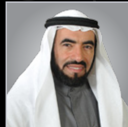
Dr. Tareq Al-Suwaidan