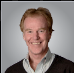
Dr. Peter Senge